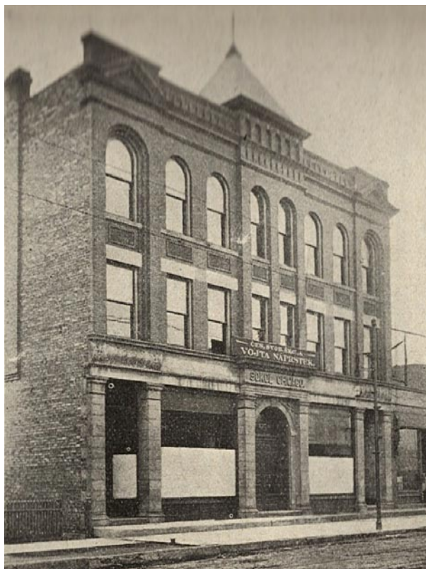
Škola Vojty Náprstka v Chicagu.