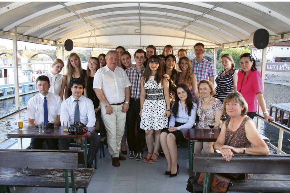
Archivní snímek z kurzu češtiny pro krajaný a bohemisty, který pořádal od roku 1990 ČSÚZ.